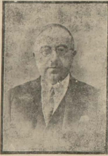
Millî İktisat ve Tasarruf Cemiyeti

Müteakiben Başvekil İsmet Paşa Hazretleri bir nutuk söyleyerek sergi